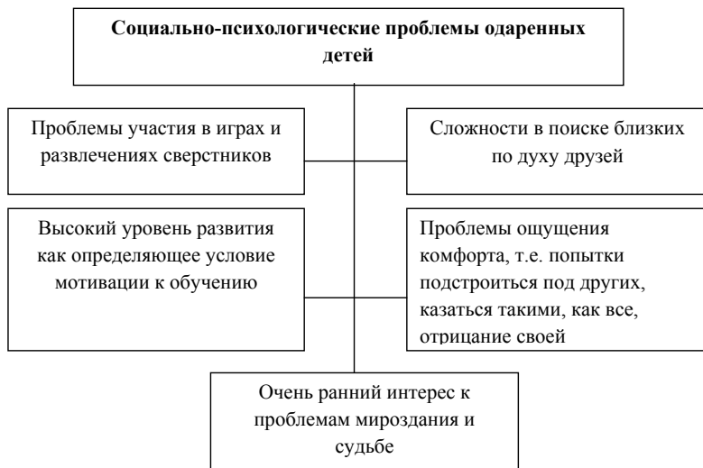
Рисунок 1. Социально-психологические проблемы одаренных детей

Данные аспекты личности одаренного ребенка способствуют формированию круга социально-психологических проблем, которые представлены на рисунке 1 [6].